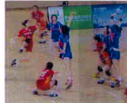
必死に守るオムロンDF

4月25日(土)～29日(水)に中国・常州 Gymnasium of Changzhou Olympic Sportsで行われた“東アジアクラブ選手権”。昨年まで3年連続三連覇をしていただけに今年は四連覇を目指しましたが、結果は3位でした。中国は、昨年の北京オリンピック開催で、かなりの強化をし、競技レベルはここ数年で間違いなく向上したよう感じました。今大会は、オムロンとして今年度初めての試合で新たな課題が沢山出ました。これを無駄にせず、今後に活かして行きたいと思えます。