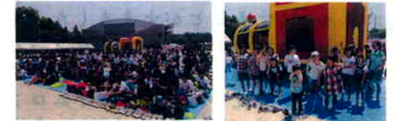
感謝祭に来てくれた多くの方 多くの子供達も来てくれました