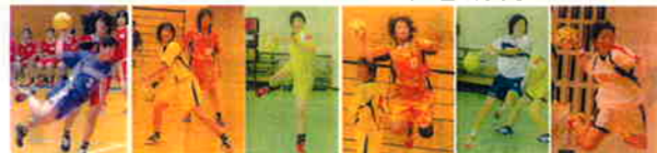
左から 天草・城北・華陵・宇土・暁・松橋の選手のシュートシーン