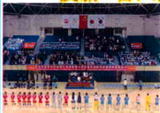
試合前に整列する両者