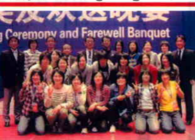
表彰式後、全員で写真撮影

《試合結果》 優勝: 碧山建設(韓国) 2位: Anhni(中国) 3位: オムロン(日本) 4位: Jiangsu(中国) 5位: Shangdong(中国)