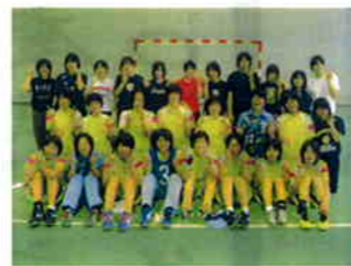
第2位に輝いた華陵高校(山口)